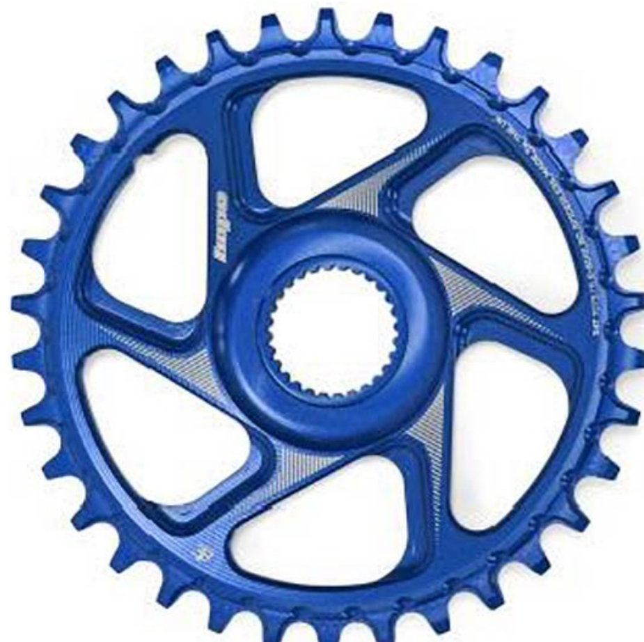
Modèle BOSCH Génération 4